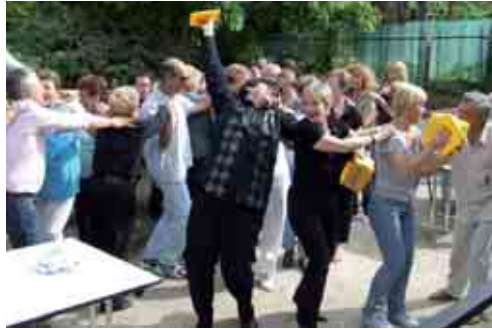
La "chenille", un des moments les plus enjoués.