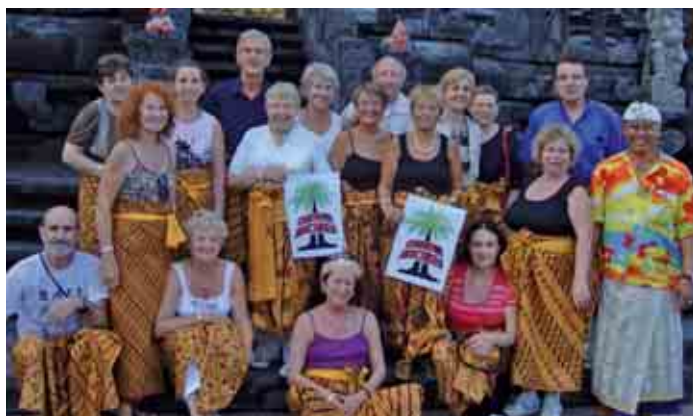
Dans le temple de Goa Lawah.

45 racino-carnussiens ont exploré cette île merveilleuse du fin fond de l'Indonésie. Ils ont parcouru l'est, l'ouest, le centre de Bali. Ils ont séjourné sur l'île de Lembongan. Certains ont fait du rafting sur l'Aygun River, voire des balades à dos d'éléphant. Ils ont découvert les plages du sud, les montagnes couvertes des forêts, les collines riantes sur lesquelles les rivières étagées dessinent de jolies courbes et, surtout, une population d'une étonnante gentillesse, d'une douceur de tous les instants.