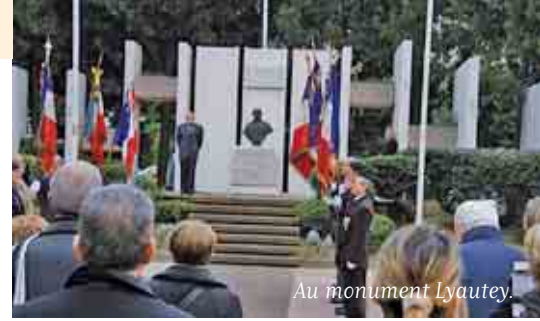
Au monument Lyautey.

Depuis sa création, l'association CARNOUX RACINES célèbre le triste anniversaire de la fusillade de la rue d'Isly et au-delà, les massacres d'Oran du 5 juillet 1962, d'El Halia en 1955 ; sans oublier Oued-zem au Maroc, ou Bizerte en Tunisie. Lors de son allocution le président M.C. s'est insurgé contre la célébration du 19 mars 1962.