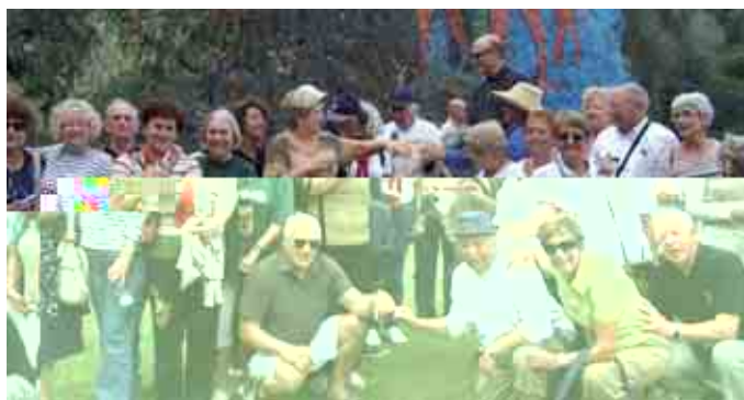
Au "Mural de la Préhistoire" dans la vallée de Viñales.

Partis pour la plus grande île des Caraïbes, à la silhouette de crocodile, 44 globe-trotteurs de Carnoux Racines en sont revenus la tête pleine de couleurs éclatantes et d'airs de salsa. En sillonnant cette île, de Santiago, Bayamo, Camaguey, Sancti Spiritus, Trinidad, Cienfuegos, Santa Clara à La Havane, ils ont décelé une terre de contrastes et, aussi, de contradictions. On aura apprécié, notamment le séjour balnéaire sur la belle plage Ancon et l'hébergement à l'hotel Nacional, lieu mythique à la Havane, mais aussi les langoustes de Trinidad.