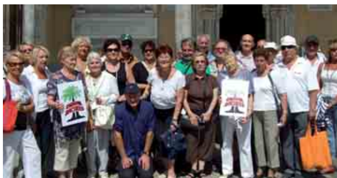
Sur le parvis du duomo de Palerme.

Une quarantaine de membres de Carnoux Racines ont opté pour le Tour de Sicile. A partir de l'hôtel Costanza Beach, situé en pleine vallée des temples, ils ont fait du balnéaire et ont visité "en étoile" la plus grande île de la Méditerranée. Notamment Agrigente, Marsala, Selinunte, les carrières de Cusa, Palerme, MonReale, l'Etna, sans oublier Taormina, cette station élégante, tant louée par Goethe et Maupassant.